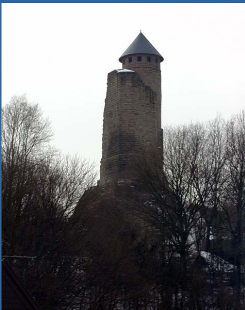
Das Franziskanerkloster in Homburg/ Saar wurde am Ende des 17. Jahrhunderts in der Zeit Ludwigs XIV. errichtet, während der französischen Revolution säkularisiert, zum Nationaleigentum erklärt, versteigert und später zerstört.

Die Burg Kirkel wird im Jahre 1075 zum ersten Male unter diesem Namen urkundlich erwähnt. Die Herren von Kirkel waren unmittelbare Vasallen der deutschen Könige und traten als gleichberechtigte Partner in Bündnissen zum Schutze des Landfriedens auf und zur Sicherung des Geleites auf der Straße vom Oberrhein zur mittleren Mosel.