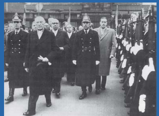
Besuch Konrad Adenauers in Saarbrücken nach der Volksabstimmung von 1955.

Aufgrund des Volksentscheides vom 23.10.1955 wurde das Saarland ab 1. Januar 1957 elftes Bundesland der Bundesrepublik Deutschland. Die wirtschaftliche Rückgliederung erfolgte am 6. Juli 1959.