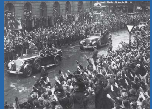
Besuch Adolf Hitlers in Saarbrücken nach der Volksabstimmung 1935.

Von der Politik verordnete Grenzverschiebungen bedeuteten immer einen Milieuwechsel ohne Umzug. Man landete, gewollt oder nicht gewollt, in einem anderen Land. Nach der „Heimkehr ins Reich“ am 1. März 1935, für die sich 90,4 Prozent der Wähler am 13. Januar entschieden hatten, musste man sich im Saarland rasch an Ausnahmezustände gewöhnen: Das Land gehörte zum Verteidigungsbereich „Rote Zone“, es wimmelte von Verboten und Kontrollen. Dann war wieder Krieg. Die meisten Hitlergegner hatten von der Möglichkeit Gebrauch gemacht, nach Frankreich überzusiedeln. Viele wurden im besetzten Frankreich dann doch Opfer der Nazis, anderen gelang es, sich dem Widerstand anzuschließen.