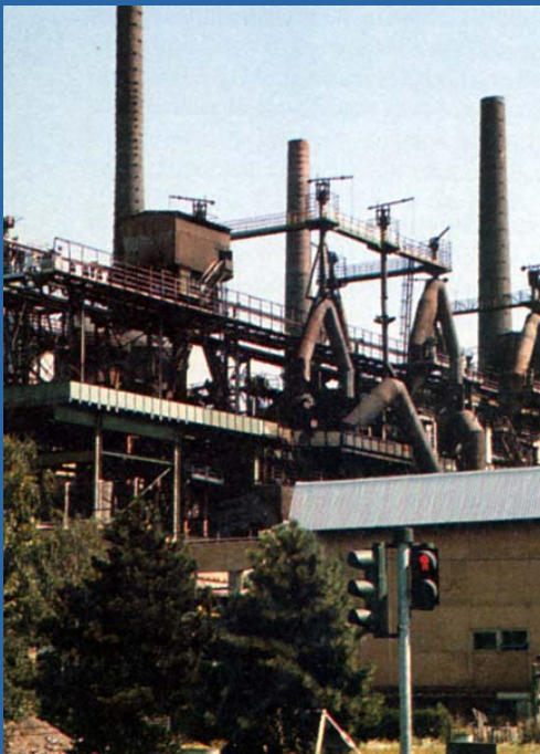
Eisenwerk in Neunkirchen

Das Flottenprogramm der kaiserlichen Regierung vom Herbst 1897 bescherte den Saalhütten Aufträge in Fülle, vor allem den Panzerplattenherstellern. Die deutschen Stahlhelme im Ersten Weltkrieg wurden ebenfalls ausschließlich in saarländischen Fabriken hergestellt.